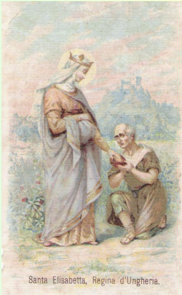
Santa Elisabetta, Regina d'Ungheria.

Dopo qualche anno la sua salute iniziò a aggravarsi da condurla alla tomba.